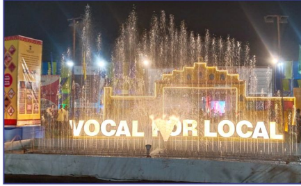
મુરુજી વેલજી મારવાડા - કચ્છ